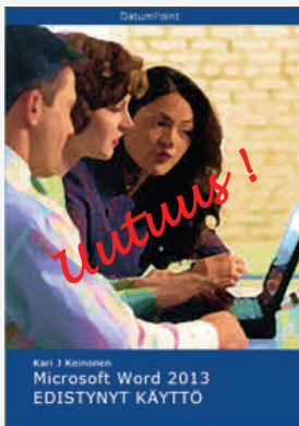
Microsoft Word 2013 - Edistynyt käyttö

Tarjoamme seuraavia itseopiskeluun sopivia e-oppikirjoja: