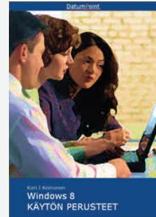
Windows 8 - Käytön perusteet

E-kirjamme toimivat erinomaisesti tietokoneen näytöllä, niiden lukemiseen ei siis tarvita erillisiä lukulaitteita.